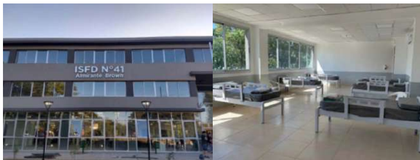
Figuras 2 y 3. ISFD N° 41 transformado en hospital de emergencia.

Adjuntamos dos fotos que, de algún modo, condensan la dramaticidad del momento que vivimos: son de un edificio que iba a inaugurarse el 30 de marzo para el ISFD N° 41, construido por el Municipio de Almirante Brown. Ante la emergencia sanitaria fue transformado en un hospital para alojar a pacientes con covid-19. Una imagen es del frente, la otra del espacio que estaba destinado a funcionar como aula.