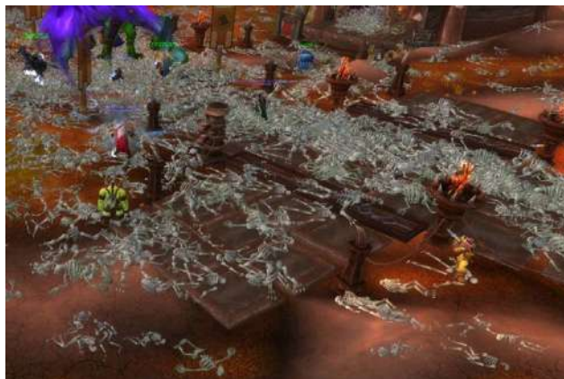
Figura 1. Captura de pantalla de World of Warcraft durante el episodio corrupted blood del año 2005.

Los cadáveres se amontonan en las plazas centrales de varios de los pueblos más importantes. Súbitamente, la salud de muchos empeora hasta la muerte sin alguna causa explicable. Luego de un tiempo, se comprende que las montañas de esqueleto son producto de un virus que empezó en las mazmorras y que se descontroló porque personajes no humanos, como mascotas, sirvieron como ruta de salida del virus fuera del entorno controlado de esas mazmorras. Rápidamente, el virus se propaga. Las autoridades emiten un comunicado donde decretan una cuarentena voluntaria para que las personas no visiten los pueblos y para que eviten desplazarse. Sin embargo, muchos curiosos se acercan para deleitarse con la escena de los cadáveres amontonados; algunos se infectan y pagan con su vida el precio de la curiosidad.