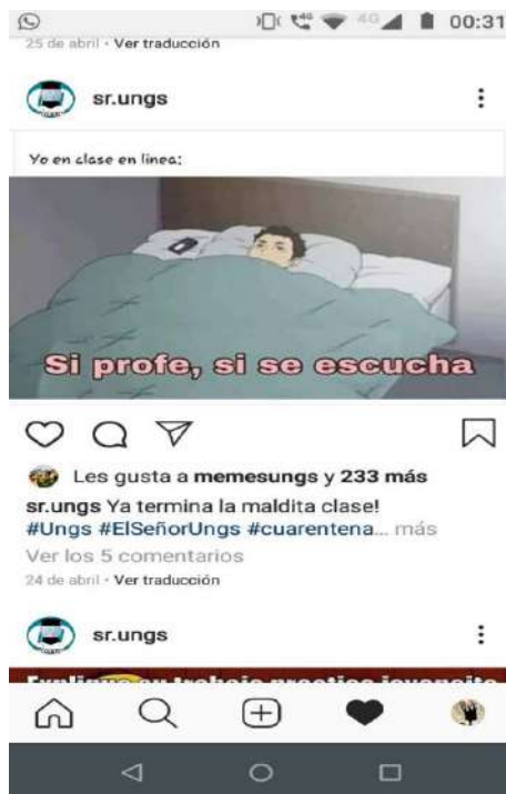
Figura 1. Meme elaborado por estudiantes de la UNGS.

Efectivamente, luego de una primera etapa de adaptación a la novedad, de entusiasmo por preservar el contacto, la relación, el vínculo –o, mejor dicho, por sostener una conversación, tal como planteó Inés Dussel (2020) en un webinar organizado por el Instituto Superior de Estudios Pedagógicos de Córdoba que logró una enorme circulación; posiblemente porque brindó pistas y guías allí donde casi nadie sabía cómo moverse–, se percibe cierto cansancio y estancamiento en las dinámicas.