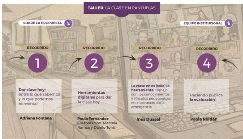
Figura 1. Imagen de una vista general del taller virtual «La clase en pantuflas».

Más de quinientos cursantes lo comenzaron, y están terminando mientras escribo estas páginas. Dada la ocasión, jugamos con la metáfora de la casa y con los recorridos por diferentes lugares en los que invitamos a los colegas cursantes a leer, seguir estudiando, participar en una feria de herramientas digitales en la que «experimentar» Twitter, Facebook live; Padlet, Telegram, Instagram, entre otras; a ver lo que está pasando en las redes, etc. (Figura 1).